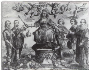
I. van Beverwijk, 'Uitnemenheit der vrouwen', gravure, 2e helft 17e eeuw